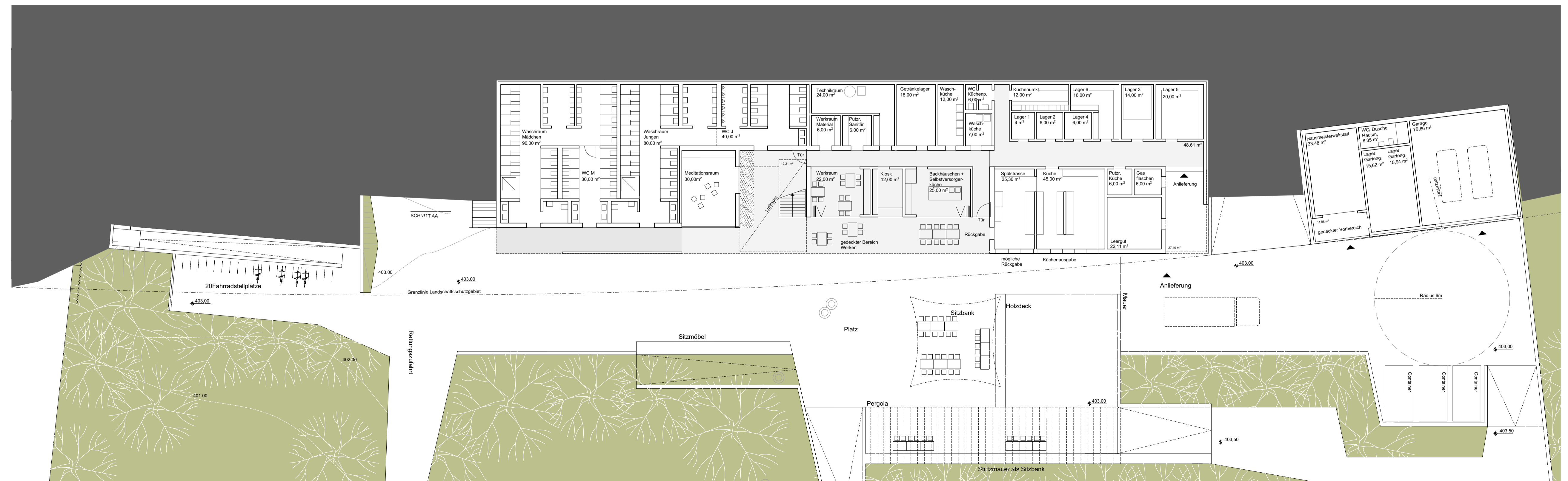
GRUNDRISS HANGGESCHOSS 1:200