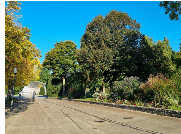
Linde Standort östlich Musikmuschel