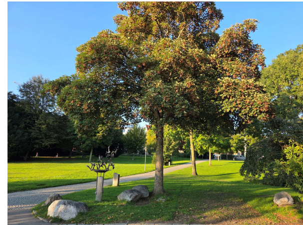
Bergahorn Standort westlich Musikmuschel