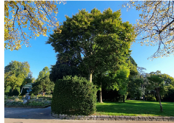
Rotbuche Standort östlich Musikmuschel